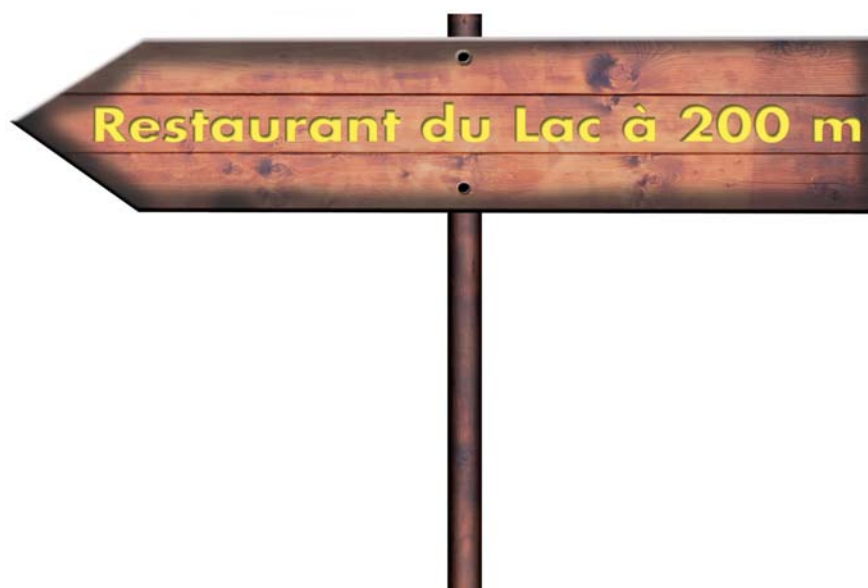
Panneau directionnel à déclarer au titre de préenseigne

Les guitares situées à l'intérieur du magasin destinées à la vente ne sont pas concernées par la TLPE.